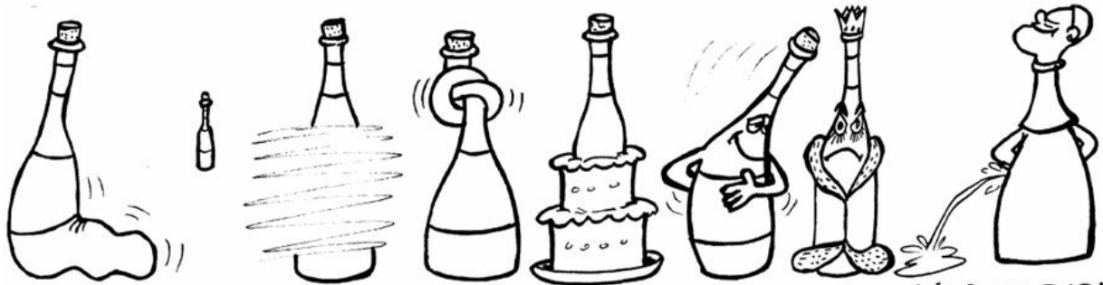
VERMENTINO PICCOLIT NEBBIOLO GROPELLO DOLCETTO CORTESE REFOSCO FONTANA DI PAPA