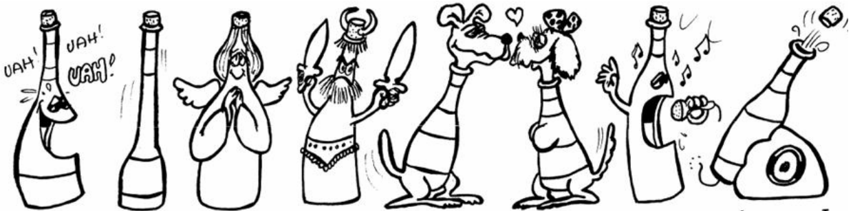
RIESLING COLLIO SOAVE BARBARESCO BRACCHETTO CAGNINA CHIANTI CANNONAU