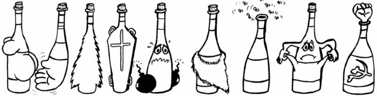
BOVARDA TOCAI PINOT BAROLO TRAMINER BARBERA MOSCATO VERDICCHIO EST-EST-EST